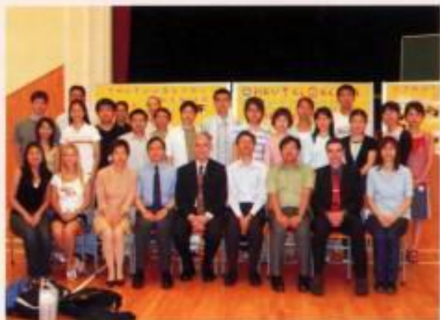
英文班普通話班導師大合照

編者按：『輕輕鬆鬆學英文』和『開開心心講普通話』是英皇書院與香港大學教務處合作的兩項嘗試，透過招募香港大學海外交換生為導師，在課餘到英皇書院與學生進行輕鬆自由的交談，讓同學在一個輕鬆和沒有壓力的環境下，自然地與以英語或普通話為母語的導師溝通。