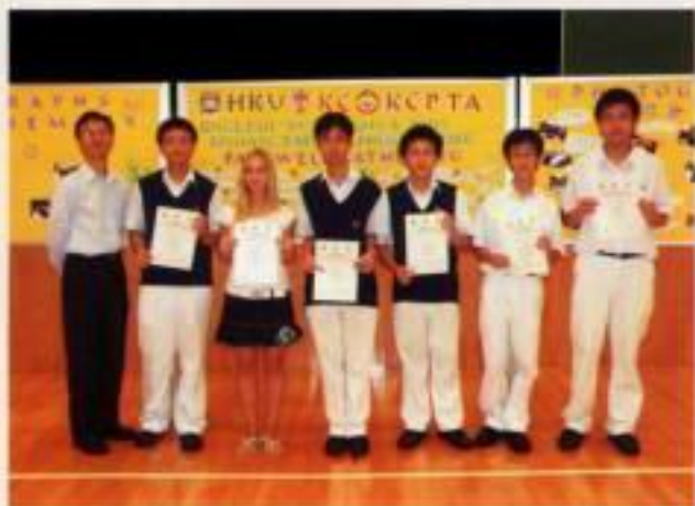
英文班導師與學生合照